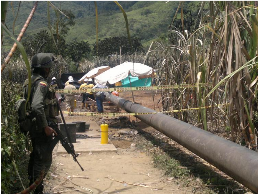
Oleoducto Caño Limón - Coveñas